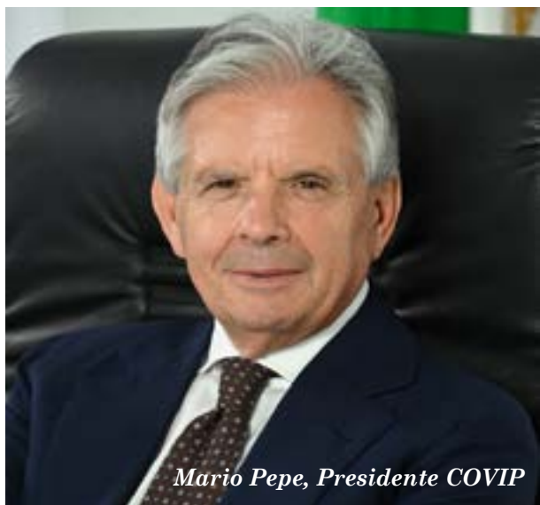
Mario Pepe, Presidente COVIP

I fondi pensione negoziali rappresentano storicamente l'architettura previdenziale "a misura di lavoratore". Costituiti attraverso contratti e accordi collettivi stipulati dalle organizzazioni sindacali e datoriali maggiormente rappresentative, essi incarnano la funzione sociale dell'autonomia collettiva ex art. 39 della Costituzione, declinata nella tutela del benessere differito del lavoratore dipendente. La natura paritetica della loro governance – che vede una rappresentanza simmetrica di lavoratori e datori di lavoro negli organi di amministrazione e controllo – costituisce, come rimarcato dalla COVIP, un presidio fondamentale di trasparenza, contenimento dei costi di gestione e aderenza alle specificità dei singoli comparti produttivi.